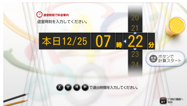
【料金シュミレーション：時間指定】 ※退室時刻を入力してのご利用金額は？