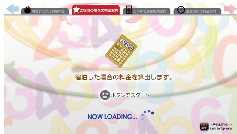
【料金シュミレーション：宿泊】 ※宿泊した際のご利用金額は？